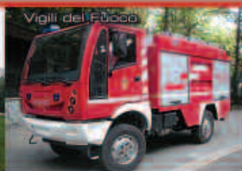
Vigili del Fuoco

BSI Veicoli S.p.a. - Sede e stabilimento: Zona Ind. Arielli 66030 - (Ch)