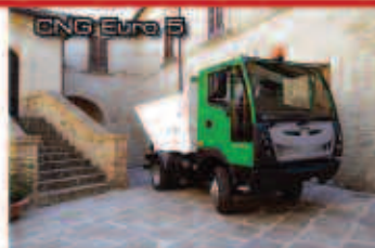
CNG Euro 5