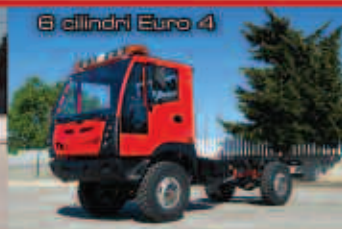
6 cilindri Euro 4