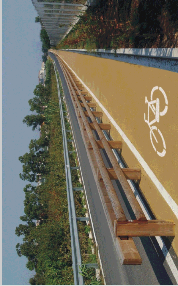
Double protection road/cycle track barrier