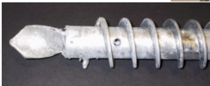
■ particolare della punta e foro tra le spire

Il sistema di palo a rapida infissione, autoperforante, brevettato, semplice ed efficace per coprire le maggiori esigenze legate alle problematiche di fissaggio ed ancoraggio di oggetti o strutture in tutte le tipologie di terreno.