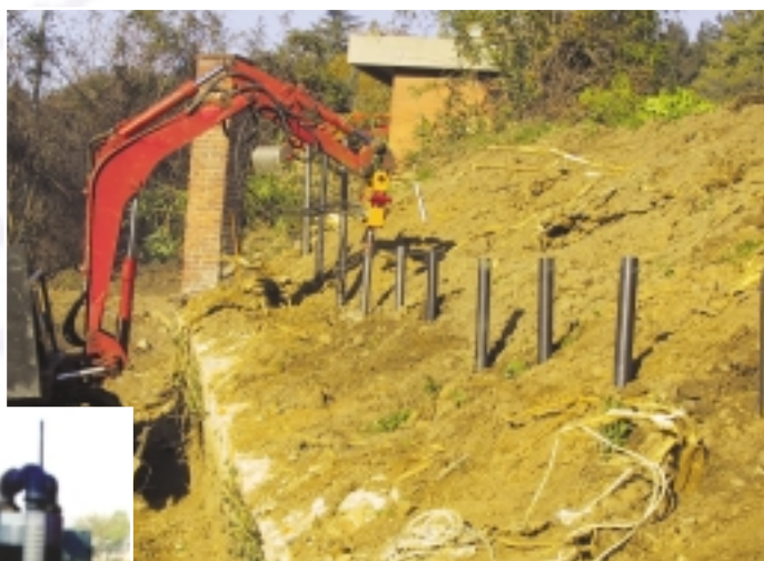
■ esempi di infissione

Il sistema permette con un'apposita apparecchiatura dotata di motore pneumatico, idraulico o meccanico, di fare penetrare rapidamente il palo nel terreno, grazie alla spira in acciaio e alla punta elicoidale di cui è munito, con la semplice rotazione il palo si infigge nel terreno.